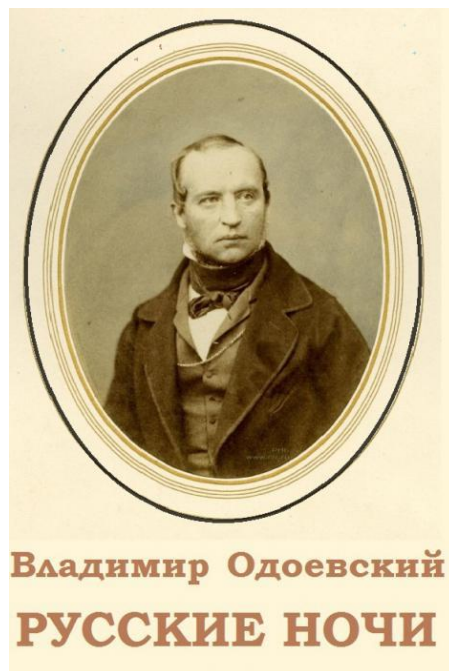
Владимир Одоевский РУССКИЕ НОЧИ

В книгу вошел первый в России философский роман "Русские ночи" (1844) В.Ф. Одоевского. Этот роман - самое значительное произведение Одоевского, вобравшее в себя многие его замыслы, синтезировавшее его воззрения на жизнь, выразившее в цельном и концентрированном виде его любимые философские идеи. Это итоговое произведение в точном смысле этого слова.